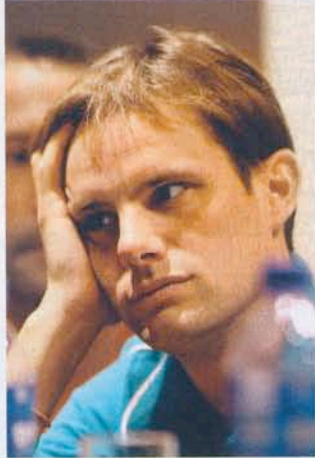
Quand le rêve du grand favori, Nicolas Touzaint, s'écroule à cause d'un coup de tonnerre...