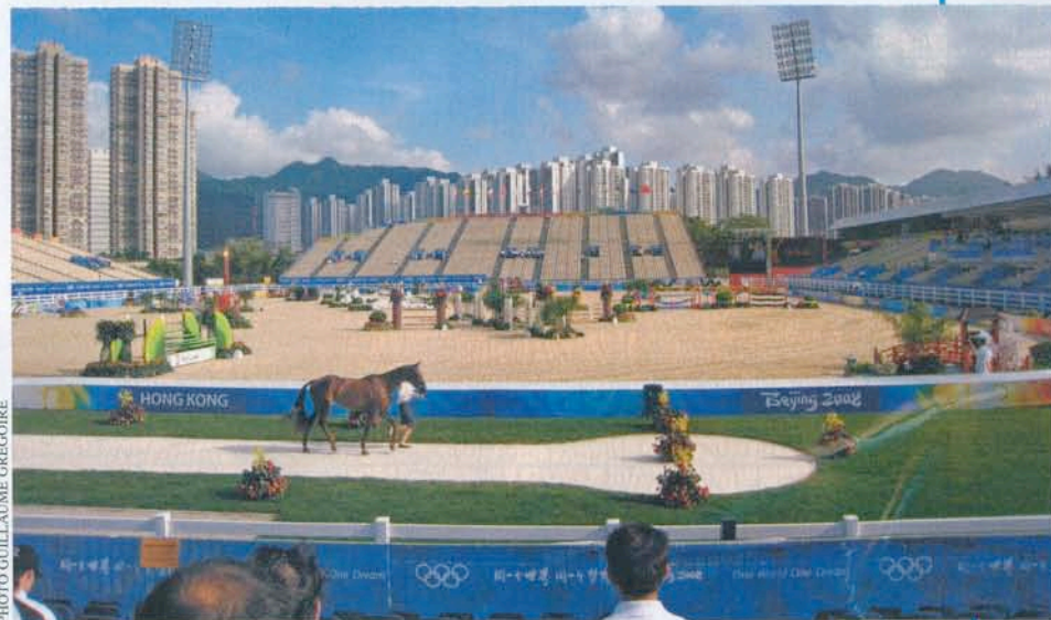
La visite vétérinaire, près du stade équestre olympique ; nos cavaliers ne deviendront pas des Hong Kong stars dans ce Las Vegas de bazar...