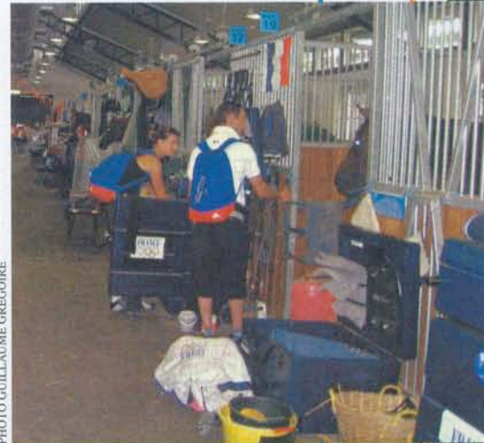
Ci-dessus. Vue des écuries de l'équipe de France.